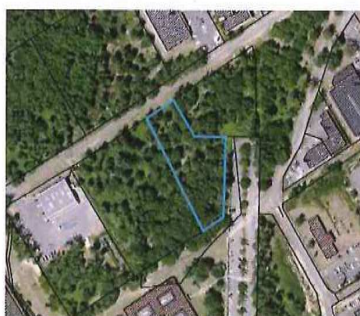
Parcelle en nature de taillis.