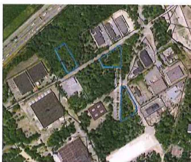
Parcelles en nature de taillis.