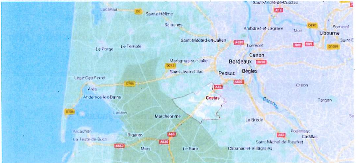
Localisation de la commune de Cestas

L'objet de la présente modification est de permettre l'extension de la zone d'activités dénommée « Pot au Pin », située à environ sept kilomètres au sud-ouest du centre-ville, à proximité immédiate de l'autoroute A63. Cette extension nécessite de reclasser les 52,8 hectares de la zone 2AUY en zone 1AUY à vocation d'activités économiques en modifiant les règlements écrit et graphique et en créant une orientation d'aménagement et de programmation (OAP).