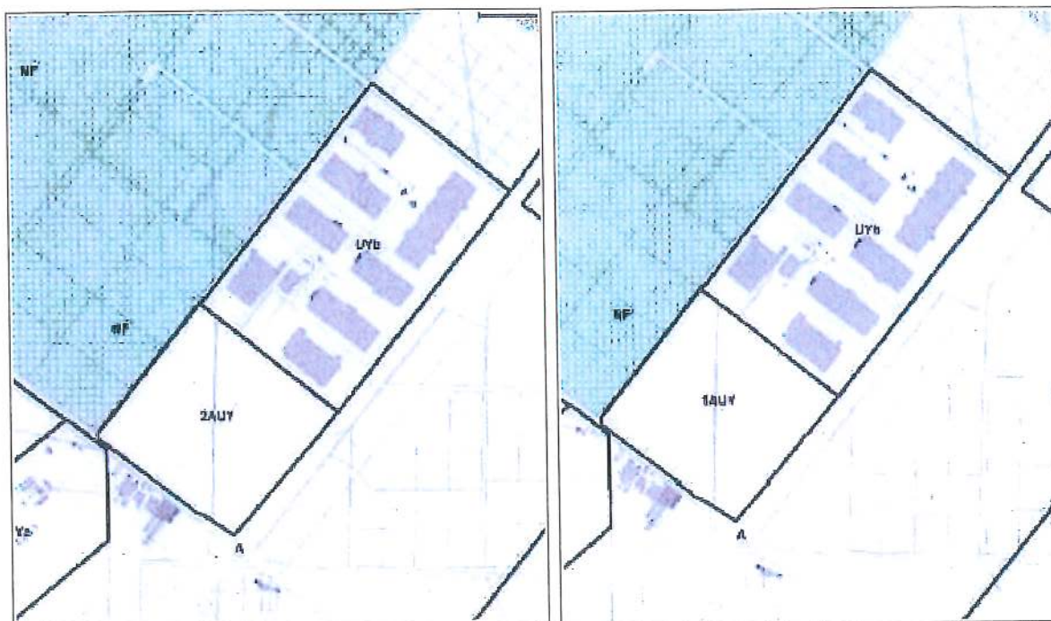
Règlement graphique du PLU avant (à gauche) et après (à droite) la modification (source : Évaluation environnementale)

Le PLU actuellement opposable ne comportant pas de zone 1AUU, la modification porte sur la création du règlement graphique 1AUU et d'un règlement écrit de sous-zonage 1AUU qui complète le règlement écrit de la zone 1AU réservée, dans le PLU actuel, à l'urbanisation future à caractère d'habitat.