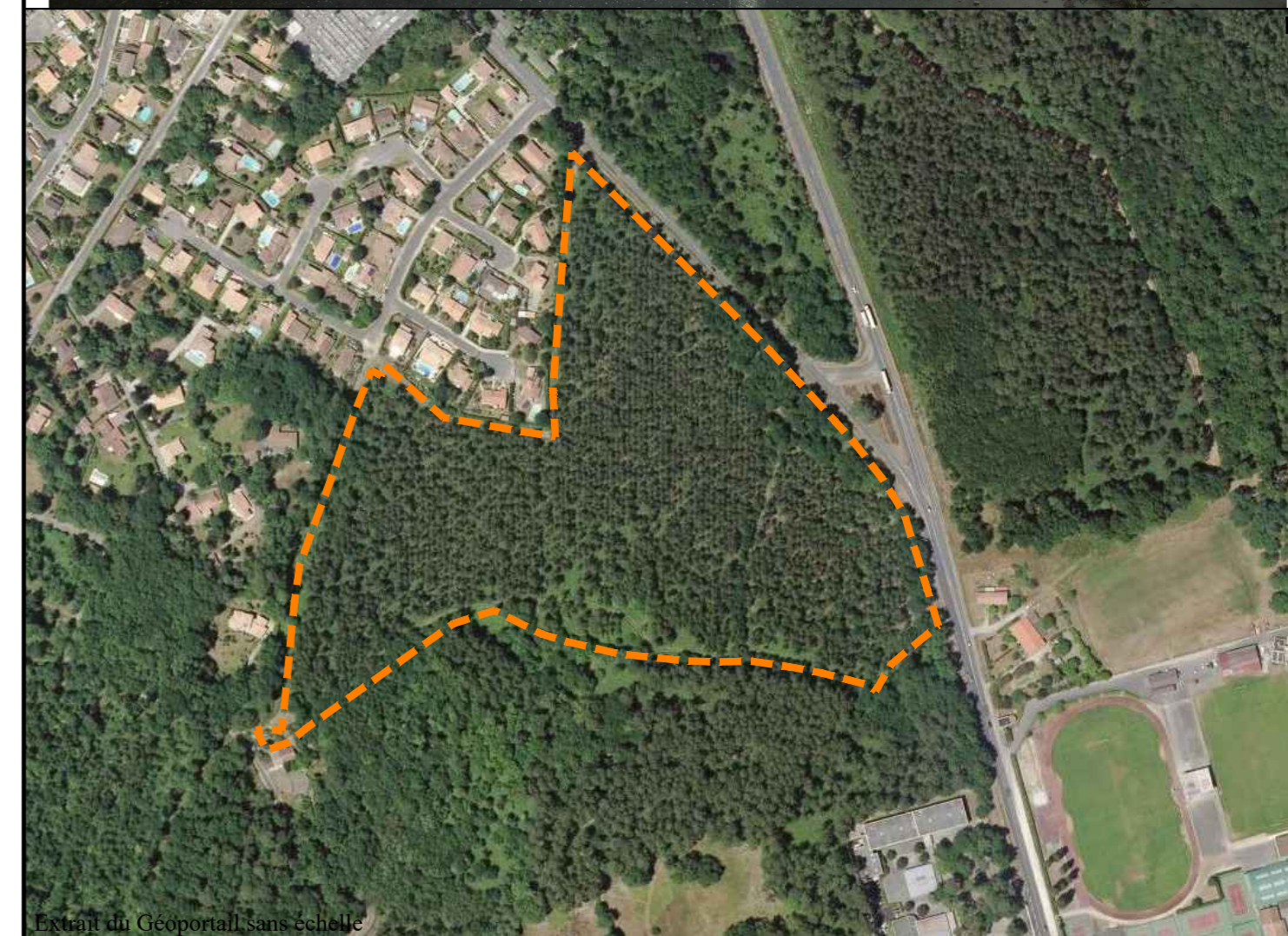
Extrait du Geoportail, sans échelle