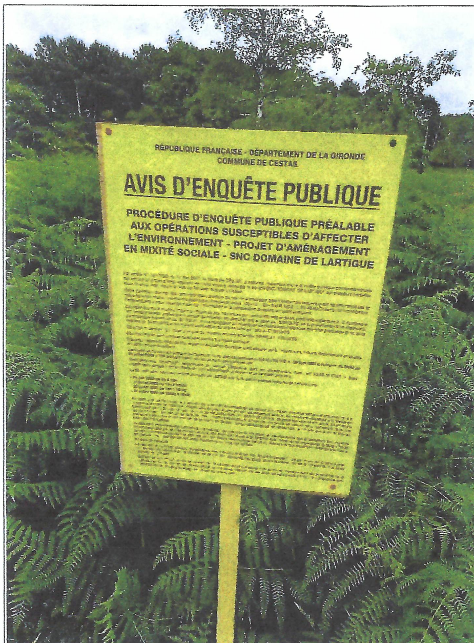
Affichage présent avenue Salvador Alende.